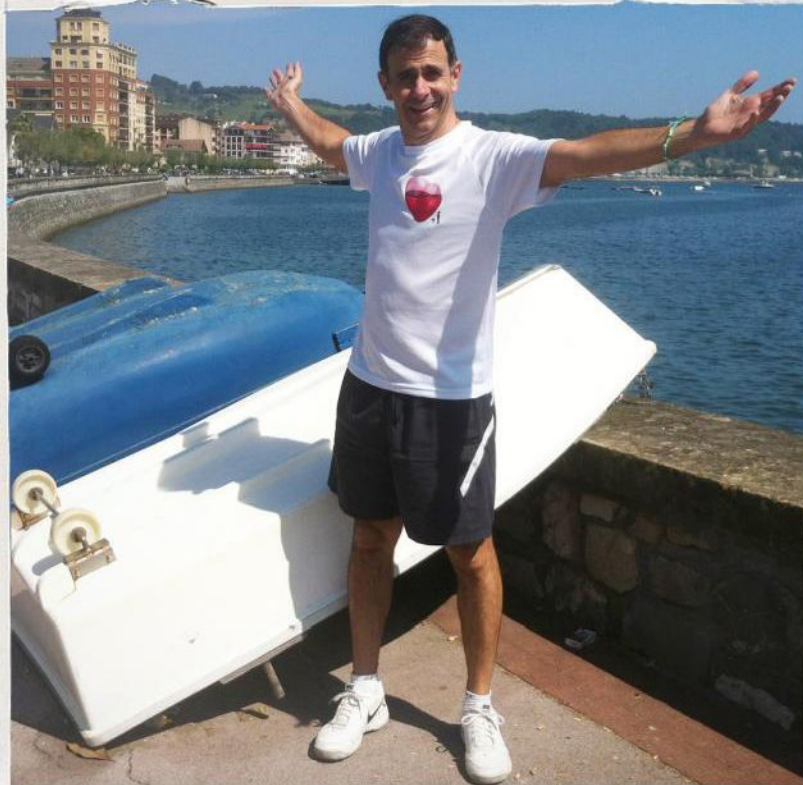
JUAN MANUEL COTELO Regisseur von Footprints

Der Jakobsweg war in Gefahr für mich eine rein platonische Liebe zu bleiben. Er zog mich an, er umwarb mich... übertrieben diejenigen, die ihn schon gegangen waren? Was hat dieser Weg, der Menschen anzieht, die eigentlich nicht gerne zu Fuß gehen? Warum pilgern so viele nach Santiago, die von sich behaupten nicht einmal gläubig zu sein? Warum schleppen sie sich mit Blasen an den Füßen dorthin, wenn sie doch einfach mit dem Zug, dem Bus, oder dem Flugzeug reisen könnten? Wenn ich den Erzählungen derer lauschte, die ihn schon gegangen waren, wurde meine Sehnsucht diesen Weg auch zu gehen noch größer... obwohl mir niemand meine Fragen beantworten konnte. „Das kann man nicht erklären. Du musst es selbst erleben. Es ist eine ganz persönliche, tiefe Erfahrung. Kein Pilger ist wie der andere.“